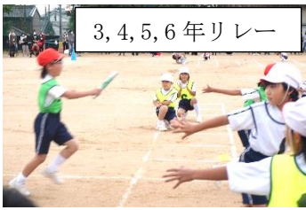
3, 4, 5, 6年リレー