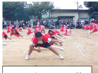
4, 5, 6年ソーラン節