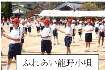
ふれあい龍野小唄