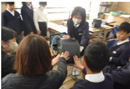
5年生の皮革資料館の紹介

4年生は、北館3階の学習室を「なぞ解き資料館」にして、お城について学習してきたことを展示し、それをもとに説明しました。自分の言葉で伝える様子に、地域の方も感心されました。「今まで住んでいたけれど、今回初めて知ったわ。」といった内容に関するコメントも数多く聞くことができました。それだけ子どもたちの説明が聞き手をひきつけたのだと思います。