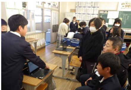
6年生の重伝建地区のおすすめ紹介

5年生は、たつの市の地場産業「皮革」について調査したことを発表しました。工場見学で学んだことを入れながら分かりやすい説明を心がけることができました。