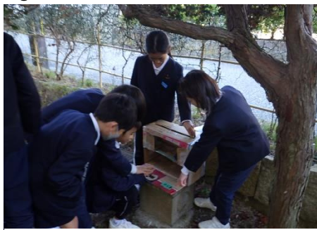
3年生が説明する様子