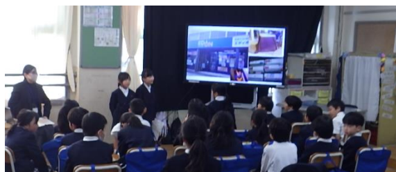
2年生のまちたんけん発表会

とふれあうことは、子どもたちのまちへの関心を高めるよい機会です。1年生は、地域の昔遊び先生の話聞きながら、遊びを楽しんでいました。また2年生もたんけん得た事実をわかりやすく説明することができていました。どちらの学年も、笑顔や自信たっぷりの表情がとってもよかったです。