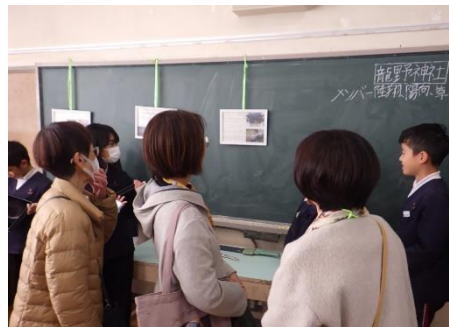
4年生のなぞ解き資料館

11月30日のオープンスクール1日目は、龍野学での学びを地域の方、保護者様、そして他学年の子どもたちに発表しました。これは、「見る・聞く・話す!」のうちの「話す活動」です。3年生は、岩石園、カラタチ、赤とんぼを話題に発表しました。子ども